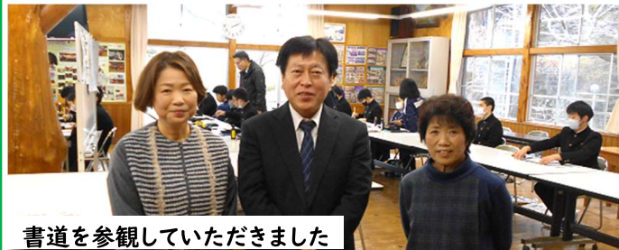
書道を参観していただきました