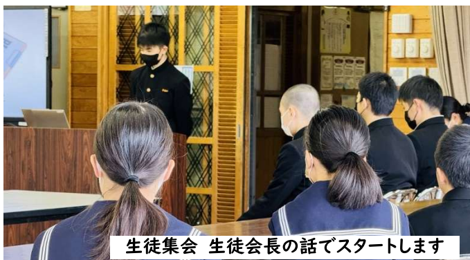
生徒集会 生徒会長の話でスタートします

まると大運動会、文化発表会、フランス歓迎交流会など、目標を高く掲げ、3年生を中心に力を合わせて実行し、たくましく成長していく姿を見せてくれました。