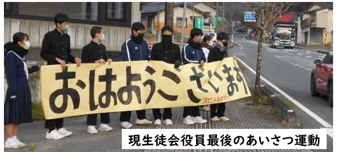
現生徒会役員最後のあいさつ運動