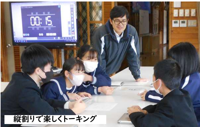
縦割りで楽しくトークキング

お互いのことを知り、さらによりよい関係をつくるきっかけにしてほしいと願って全校でのトークタイムをスタートしました。