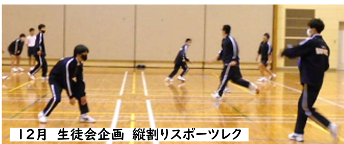
12月 生徒会企画 縦割りスポーツレク